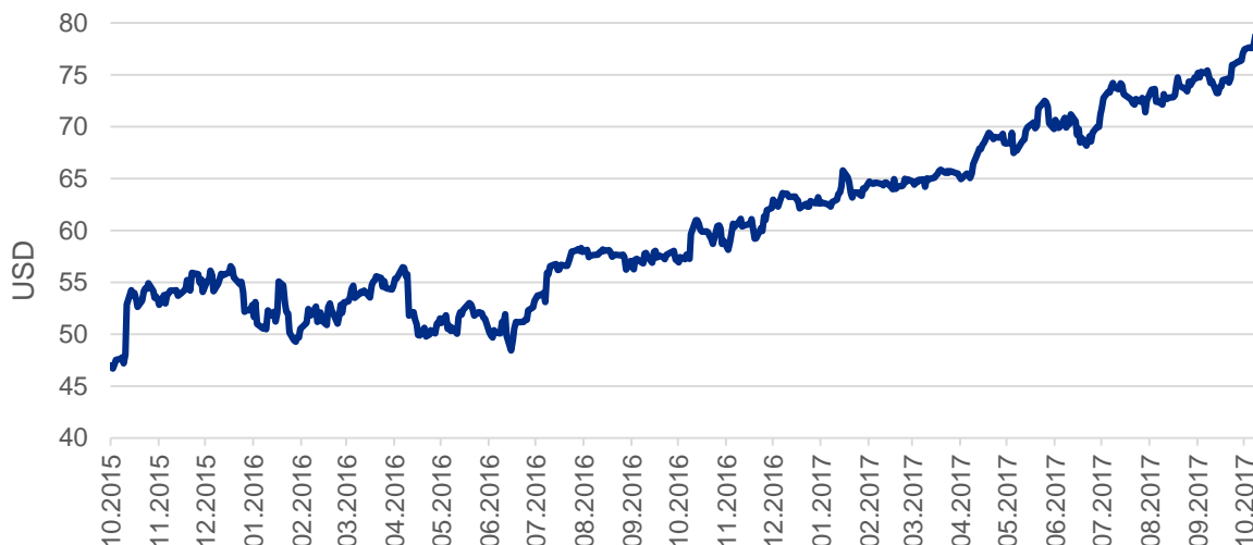
Graf: Vývoj ceny akcií Microsoft

Stejně tak i zisk a tržby společnosti Amazon překonaly odhady analytiků. Její tržby stouply o 34 % na 43,5 miliardy dolarů (zhruba 960 miliard korun) a společnost očekává jejich další nárůst v nadcházejícím předvánočním období. Čistý čtvrtletní zisk vzrostl o 1,6 % na 256 milionů dolarů (zhruba 5,7 miliardy korun). Zisk na akcii tak činil 52 centů, přičemž analytická očekávání byla jen na úrovni 2 centů na akcii. Ve čtvrtletních výsledcích se poprvé objevily tržby kamenného řetězce Whole Foods. Ty přispěly k obratu největšího internetového prodejce na světě 1,3 miliardy dolarů a na provozním zisku se podílely 21 miliony dolarů.