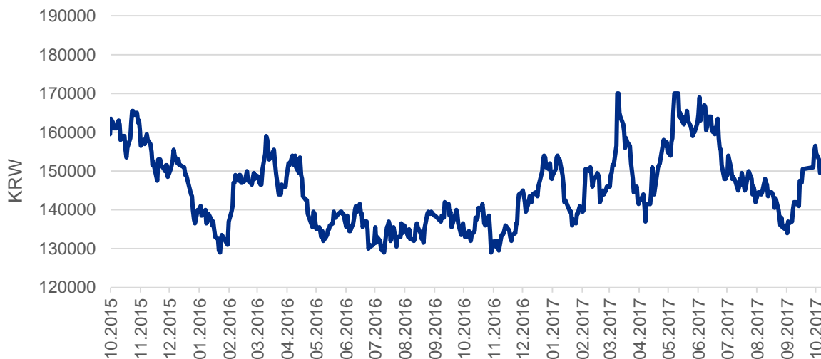
Graf: Vývoj ceny akcií Hyundai Motor

Přesto ale výsledek mírně překonal odhady analytiků, kteří podle agentury Reuters v průměru očekávali zisk 849 miliard wonů. Akcie společnosti tak mírně rostly. Spor mezi Čínou a Jižní Koreou se týká rozmístování amerického protiraketového štítu THAAD na jihokorejském území. Hyundai je největší automobilkou v Jižní Koreji a spolu se sesterskou firmou Kia tvoří pátého největšího výrobce aut na světě. Společnost Hyundai vyrábí osobní auta v Nošovicích od listopadu 2008. Sesterská Kia zahájila v prosinci 2007 sériovou výrobu u Žiliny na Slovensku.