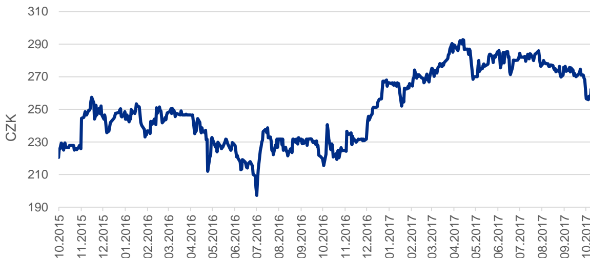
Graf: Vývoj ceny akcií O2 Czech Republic

Díky vyššímu zájmu zákazníků o mobilní data (datový provoz se meziročně zvýšil o 94 %), placenou televizi a finanční služby, však O2 překonalo odhady analytiků a meziročně zvýšilo čistý zisk o 1,4 % na 1,48 miliardy korun. Počet mobilních zákazníků O2 dosáhl ke konci září 4,9 milionu a zůstal tak na stejné úrovni jako loni. Více lidí než loni ale využívá služby O2 na základě smlouvy. Jejich počet vzrostl za poslední rok o 1,6 % na téměř 3,4 milionu. Majoritním vlastníkem O2 je skupina PPF, které patří přes 81 % akcií. Většina ostatních cenných papírů se obchoduje na pražské burze. Akcie na výsledky reagovaly růstem a dostaly se zpět nad úroveň 270 korun.