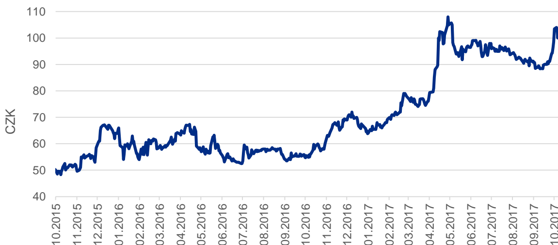
Graf: Vývoj ceny akcií Central European Media Enterprises

Skupině pomáhá především růst zájmu inzerentů o televizní reklamu. Příjmy z ní vzrostly meziročně o zhruba 10 %. Tržby z placených kanálů pak rostly dokonce o 20 %. Provozní zisk před odpisy a amortizací (OIBDA) skupiny vzrostl o 30,1 % na 25,1 milionu dolarů (zhruba 548 milionů korun). V Česku však zisk klesl o 4,3 % a činil 12,6 milionu dolarů. Akcie skupiny se obchodují na burze v Praze, kde akcie na výsledky reagovaly mírným poklesem.