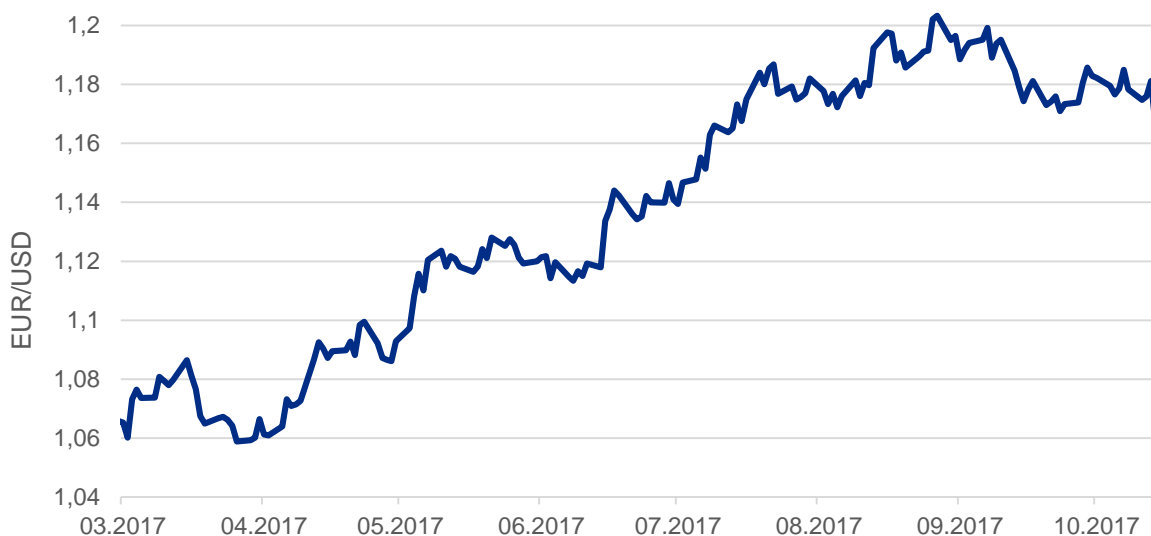
Graf: Vývoj kurzu měnového páru EUR/USD

Rada guvernérů ECB v čele s předsedou Mariem Draghi rozhodla, že do konce roku bude v rámci programu nákupu aktiv nakupovat státní a firemní dluhopisy v objemu 60 miliard eur měsíčně. Od ledna pak bude v nákupech pokračovat, ale jen za 30 miliard měsíčně. Tento program zahájila ECB v březnu 2015 a bude trvat do září 2018 případně déle. To bude záležet především na vývoji inflace v eurozóně. Ta se stále drží pod 2% cílem ECB. V září činil meziroční růst spotřebitelských cen v eurozóně pouze 1,5 %. Euro reagovalo na rozhodnutí ECB mírným posílením. Zvětšující se rozdíl mezi sazbami v eurozóně a v Česku by mohl mít za následek rychlejší posilování české koruny.