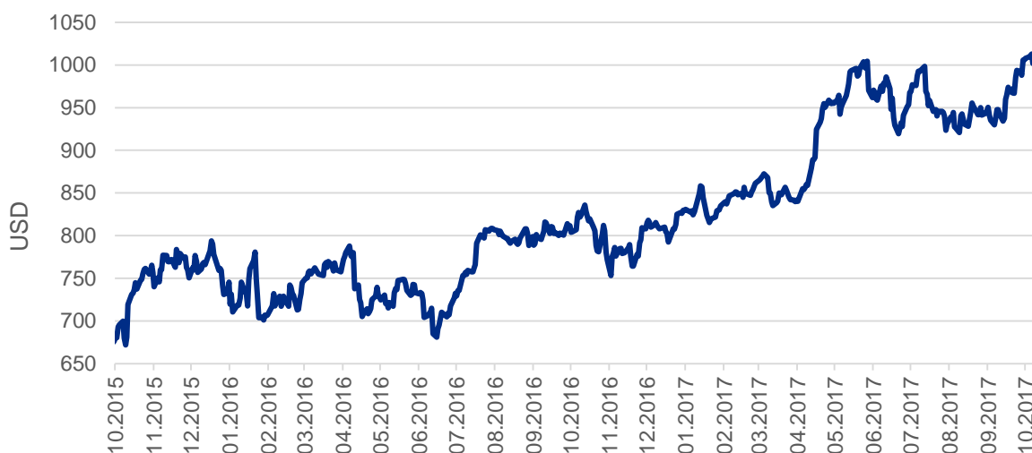
Graf: Vývoj ceny akcií Alphabet

Dařilo se také společnosti Microsoft, i když ne tak výrazně. Příjmy se za tři měsíce do konce září, které jsou pro Microsoft prvním fiskálním čtvrtletí, zvýšily o 12 % na 24,54 miliardy dolarů (zhruba 540 miliard korun) a čistý zisk dokonce o 16 % na 6,58 miliardy dolarů (zhruba 145 miliard korun). Výsledky překonaly očekávání analytiků díky poptávce po cloudových službách a stabilizaci poptávky po softwaru pro osobní počítače.