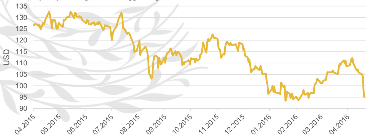
Graf: Vývoj ceny akcií společnosti Apple za poslední rok

Další ránou pro Apple bylo, když známý miliardář a investor Carl Icahn oznámil, že prodal svůj podíl ve společnosti Apple. A to především kvůli vztahům společnosti s Čínou. Nejen, že má Apple v Číně silnou konkurenci v podobě společnosti LeEco, čínské úřady také zavřely služby Applu, jako je iTunes Movies nebo iBooks, což ukázalo, že ani největší společnost světa není vůči vlivu regulátorů z Pekingu imunní. Jinými slovy, další pokles akcií, aby toho nebylo málo, minulý týden bylo objeveno v jedné ze zasedacích místností v tzv. Infinite Loop kampusu v kalifornském městě Cupertino tělo muže. Policie následně potvrdila, že se jedná o zaměstnance Apple, který spáchal sebevraždu. Akcie Applu tak zaznamenaly prudký pokles a po několika měsících se dostaly opět pod úroveň 100 USD. [1] [2] [3]