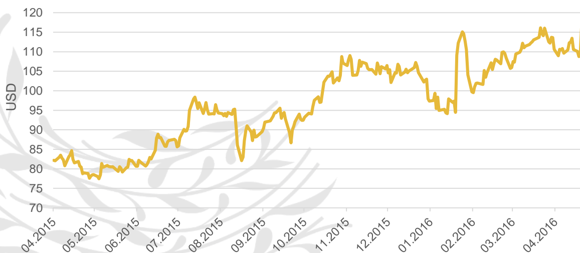
Graf: Vývoj akcií společnosti Facebook za poslední rok

Čistý zisk společnosti se dokonce téměř ztrojnásobil, když dosáhl úrovně 1,51 miliard dolarů (zhruba 36 miliard korun) oproti 512 milionům dolarů z roku 2015. Zisk na akcii činí 0,52 dolaru. Sociální síť vykázala 15% růst aktivních uživatelů na 1,65 miliardy. Facebook má navíc další služby. WhatsApp používá na světě přibližně miliarda lidí, Facebook Messenger 800 miliónů, přičemž Facebook prakticky nevykazuje tržby ani z jedné z těchto aplikací. To se v budoucnu může změnit a právě tyto oblíbené aplikace mohou významně přispět k růstu již dnes jedné z největších společností světa. Akcie společnosti mají s trochou nadsázky za poslední rok přesně opačný průběh jako akcie Applu a vykazují rostoucí trend. [4] [5] [6]