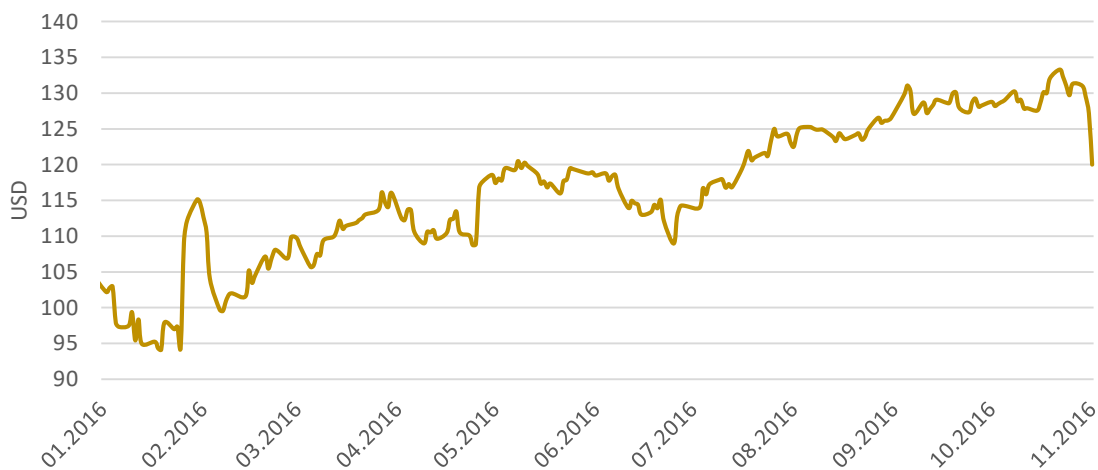
Graf: Vývoj hodnoty akcií Facebook od začátku roku

Celkové příjmy za letošek již dosáhly 18,829 miliardy dolarů (458,5 miliard korun). Více než 97 % však tvoří výnosy z reklamy, zbytek jsou platby a poplatky za služby apod. Pro Facebook navíc vzrůstá důležitost uživatelů mobilní verze. Poprvé v historii překročil miliardu počet těch, kteří Facebook používají výhradně přes mobil. Příjmy z mobilní reklamy výrazně převyšují ty z klasických počítačů, a to v poměru zhruba 84 ku 16 %. Finanční ředitel Facebooku ale oznámil, že růst příjmů v posledním letošním čtvrtletí velmi pravděpodobně výrazně zpomalí. Sociální síť totiž v podstatě dosáhla hranice množství reklamy, kterou může umístit, aniž by příliš odrazovala své uživatele. Akcie na to zareagovaly 8% propadem. [1] [2] [3] [4]