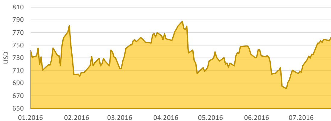
Graf: Vývoj hodnoty akcií Alphabet Inc. za posledních 6 měsíců

s 28 procentní marží. Čistý zisk společnosti dosáhl hodnoty 4,88 miliardy dolarů (zhruba 119 miliard korun) což je o téměř miliardu více než před rokem. Zisk 8,42 dolarů na akcii tak překonal odhady o téměř 40 centů. Za dobrými výsledky stojí především příjmy z reklamy na mobilním trhu, kde se zvyšovaly tržby z jednoho kliku. Stále se však Googlu nedaří vytěžit z mobilní reklamy tolik jako z té na klasických počítačích. Do budoucna sází Alphabet především na cloud. Díky dobrým výsledkům akcie společnosti mírně posílily, viz následující graf. [18] [19] [20]