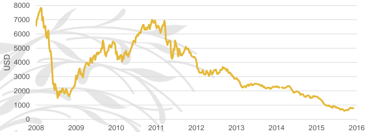
Graf: Stowe Global Coal Index